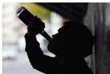
Die Drogenbeauftragte will härter gegen Alkoholmissbrauch vorgehen

„Wir müssen mehr darauf achten, dass der Bußgeldrahmen für Händler stärker ausgeschöpft wird“, sagte die FDP-Politikerin der „Rheinischen Post“ vom Montag und fügte hinzu: „Das ist kein Kavaliersdelikt.“