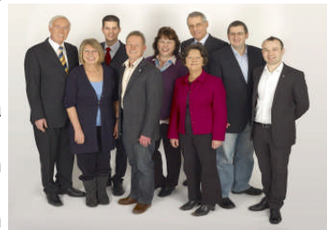
Die Liberalen Spitzen-Kandidaten in Kassel